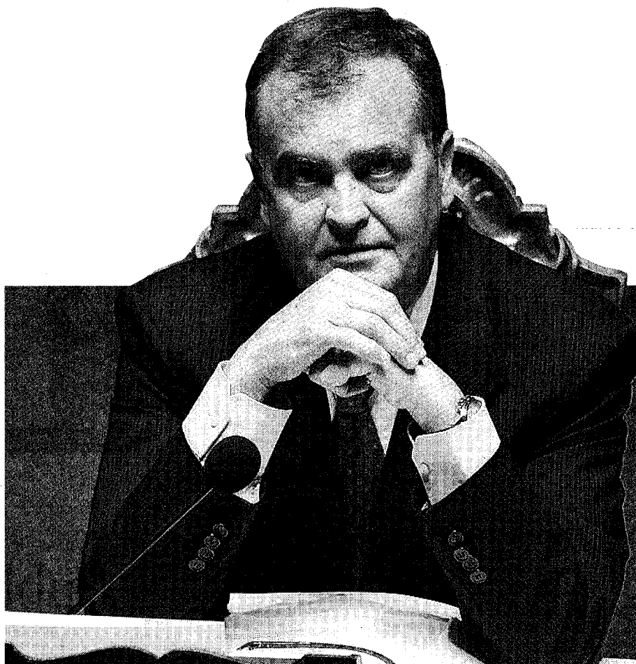
Dal 2008 Roberto Calderoli, 54 anni, è ministro per la Semplificazione legislativa